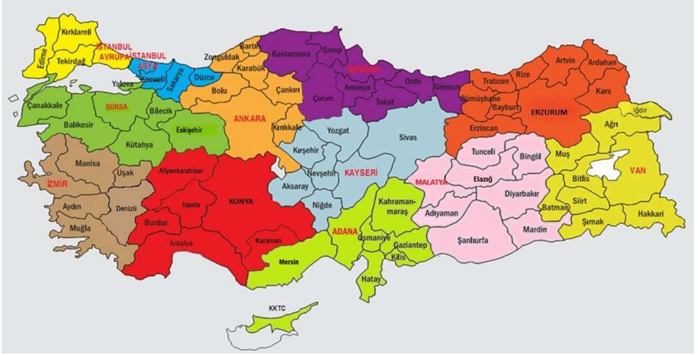
Şekil 1. Yarışma Bölgeleri Haritası

Bu yarışma Türkiye genelinde 12 bölgede yapılmaktadır. Her bölge için bir il, merkez olarak seçilmiştir. Her bölgeye il merkezinden iki öğretim üyesi, TÜBİTAK tarafından yarışmalardan sorumlu Bölge Koordinatörü ve Bölge Koordinatör Yardımcısı görevlendirilir. Adana, Ankara, Bursa, Erzurum, Konya, İstanbul Asya, İstanbul Avrupa, İzmir, Kayseri, Malatya, Samsun ve Van bölge merkezi illerdir. İllerin bölgelere dağılımları Şekil 1’de verilmiştir.